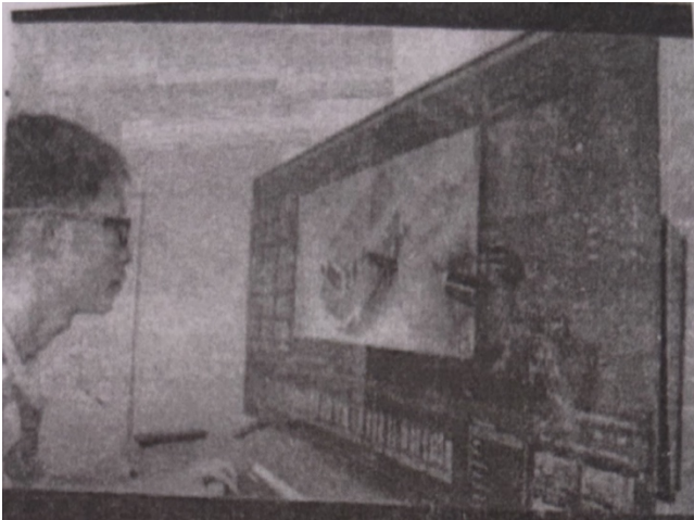
टेलिविजन का उपयोग एक कम्प्यूटर मॉनिटर के रूप में चित्र II